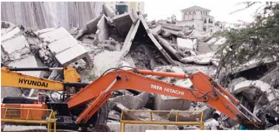
मलबे को साफ करती जेसीबी की मशीन।